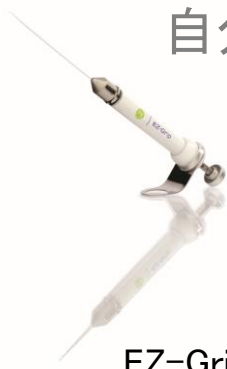
EZ-Grip (ハンドルグリップ付き)