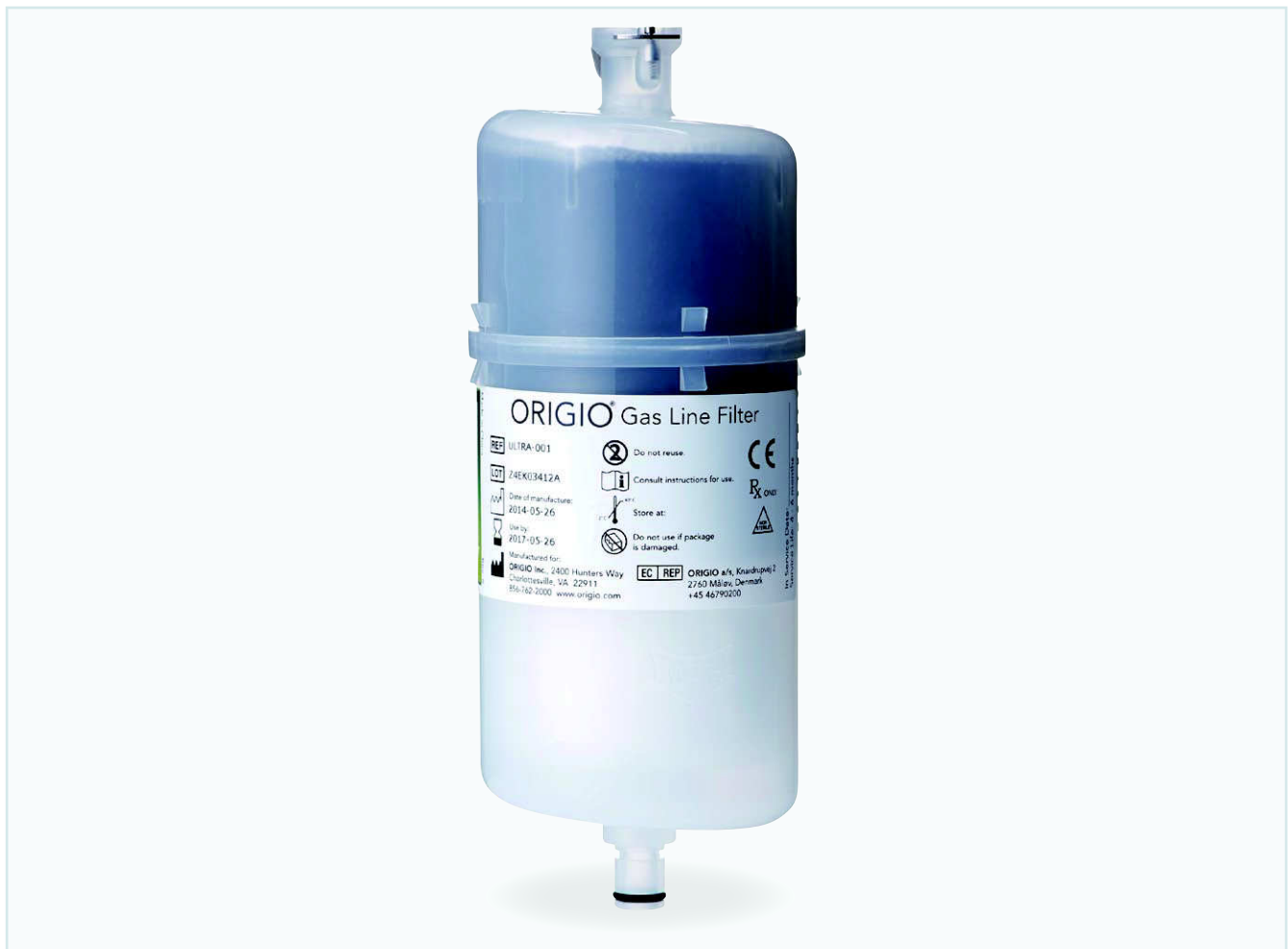
ガスラインフィルター本体

活性炭の層状構造が、 圧倒的な表面積を確保 最大6か月のロングライフを実現します。