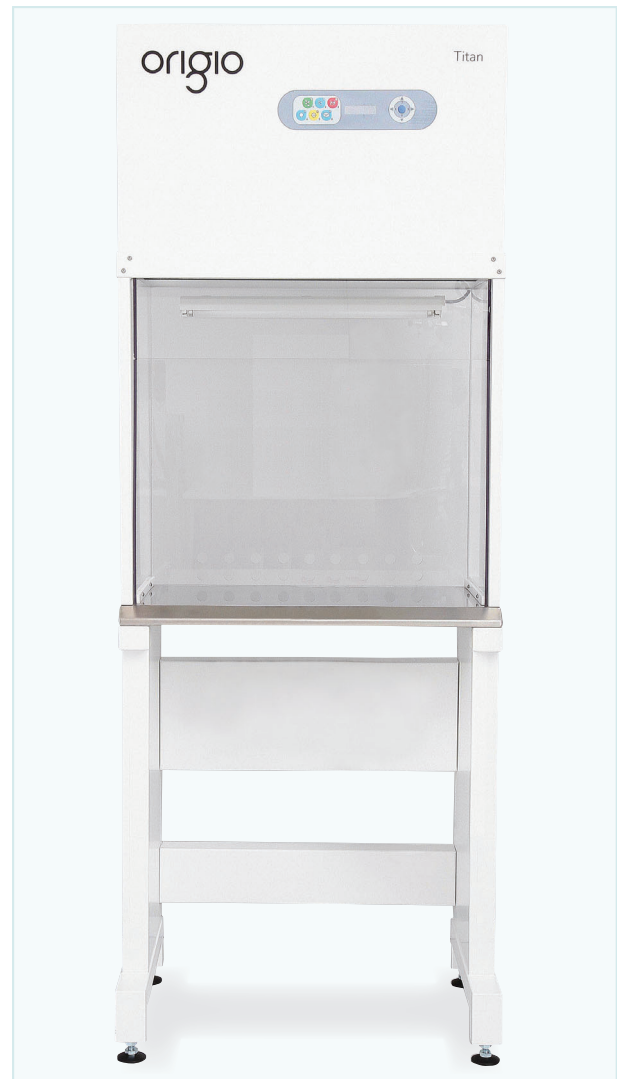
Titan LAF 固定脚型