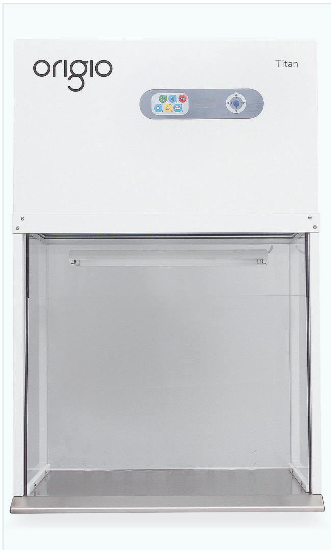
Titan LAF 卓上型