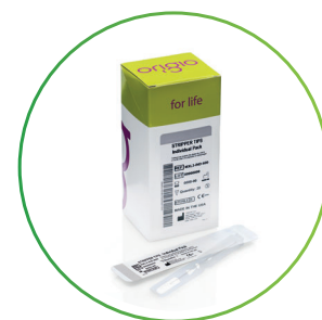
The STRIPPER® Tips 個包装タイプ