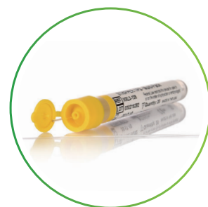
The STRIPPER® Tips 20本入パック