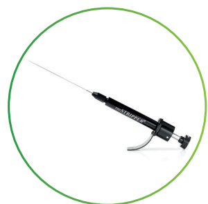
注射器タイプ The STRIPPER®

胚操作用ピペットの種類は注射器タイプ、ペンシルタイプ、ディスプレイザブルタイプの 3 種類からお選びいただけます。チップサイズは用途に合わせて計 16 種類の内径サイズが選択可能です。注射器タイプには PGD 専用、卵丘細胞複合体専用の胚操作用ピペットをご用意しています。