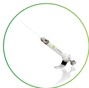
注射器タイプ RI EZ-Grip®