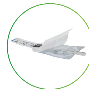
RI EZ-Squeeze™ Tips 個包装タイプ