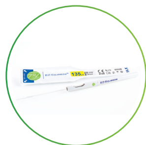
ペンシルタイプ RI EZ-Squeeze™