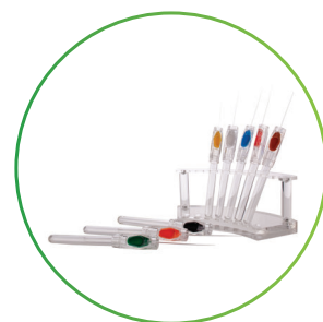
ディスプレイザブルペンシルタイプ RI EZ-Strip®